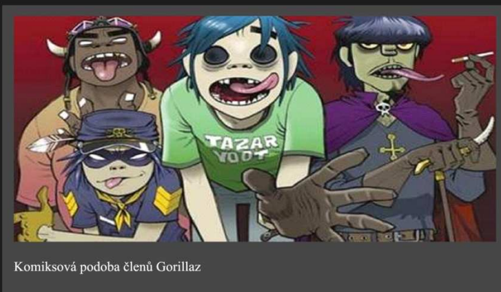
Komiksová podoba členů Gorillaz

A je to tady! Gorillaz, britská hudební skupina založená v roce 1998 Damonem Albamem a Jamiem Hewlitem, se probouzí. Vánoce jsou tady a nás čeká fantastický dárek. Na internetu bude možné volně stáhnout v pořadí již čtvrté album od této extravagantní skupiny. A proč je to tak překvapující? Nikdo to nečekal. Navíc je zajímavé to, že toto dílo vznikalo v podstatě na hotelových pokojích bez větších úprav, což se může zdát jako velký risk, ale skalní fanoušci to jistě ocení. Nicméně ještě uvidíme, jak velký potlesk Gorillaz sklídí. Každopádně jejich tvorba byla pokaždé vynikající a rozhodně se nemají za co stydět. A to nejenom z hlediska hudební, ale i grafické. Nové album jistě opět udělá díru do světa.