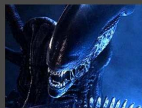
Vetřelec, navrhnutý švýcarským umělcem Hansem Ruedi Gigerem.

I když nejste velcí fanoušci sci-fi, musíte si vzpomenout na slavný hororový film Vetřelec od hollywoodského režiséra Ridleyho Scotta. Vzhledem k úspěšnosti této vesmírné ságy by se on sám rád navrátil ke starým kolegům. Chystá pro nás dva nové díly, které se odehrávají ještě předtím, než se monstrum dostalo na vesmírnou loď Nostromo . Bohužel si budeme muset ještě nějakou chvíli počkat, protože se dostanou do kin nejdříve až v roce 2013. Ale za to čekání to stojí. Připravte se na další dobrodružství v nebezpečném a napínavém vesmíru, kde člověk nezůstává na vrcholu potravinového řetězce. A co víc, možná Vám Ridley způsobí i nepříjemné chvění v oblasti žaludku.